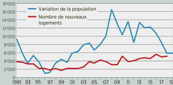
Variation annuelle de la population et nombre de logements construits dans le canton